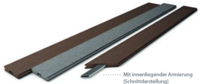
..... Mit innenliegender Armierung (Schnittdarstellung)

Beachten Sie beim Verbau temperaturabhängige Längenschwankungen (bis +/- 1,5 %) und erfragen Sie die maximale Spannweite.