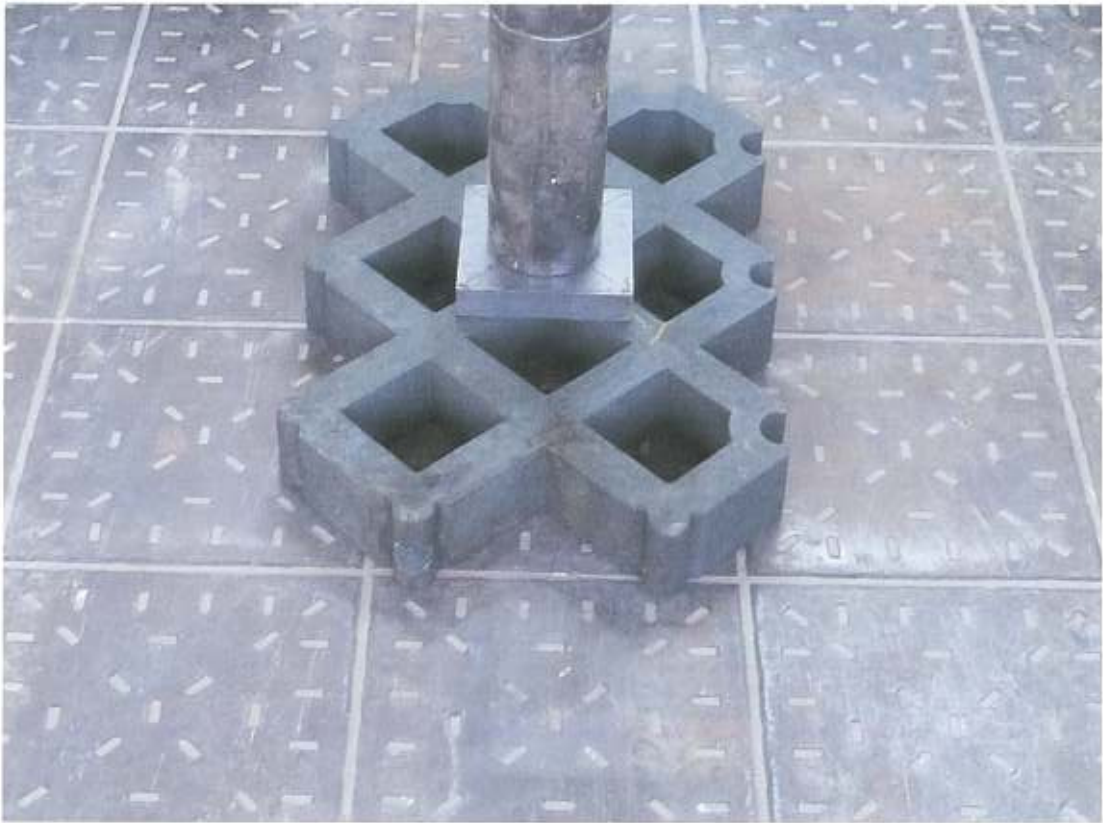
Abbildung 2: Prüfanordnung eines Kunststoffrasengittersteines auf starrem Untergrund