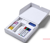
(STARTERKIT) STARTERKIT STARTERSET