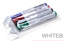
(SETFIXWB) MARKER PENS WHITEBOARDMARKER-SET