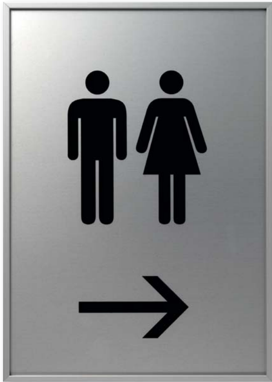
UNITEX FL als Piktogramme Format: 214 x 301 mm