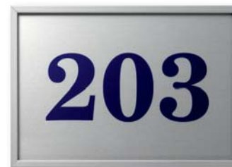
UNITEX FL Türschild Format: 155 x 110 mm