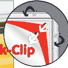
Werbefläche mit Alu-Klapprahmen – sekundenschneller Posterwechsel. Advertising space with aluminium snap frame – posters changed in seconds.