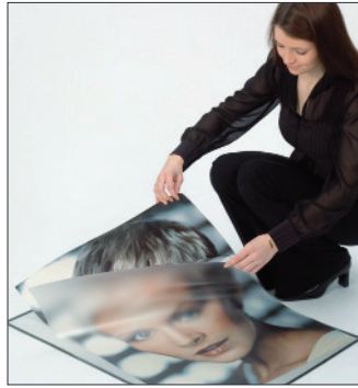
Mit zusätzlicher Folientasche, entspiegelt und wasserfest. With an extra antireflection, waterproof poster-pocket.